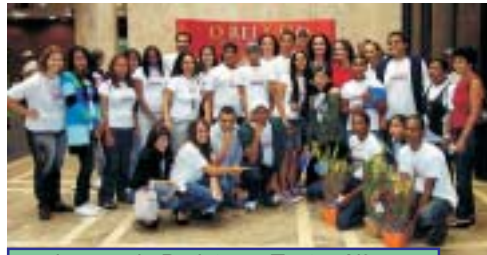
Jovens do Projeto no Teatro Alfa

E como o Anhumas faz isso? Todas as tardes, os jovens vão à associação, sediada provisoriamente na Igreja de Sant’Ana, onde tem oficinas de capoeira, Hip Hop, sapateado, música, canto, artesanato, teatro, educação física e percussão.